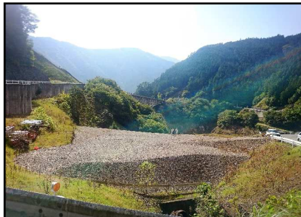
大滝は自然がいっぱい