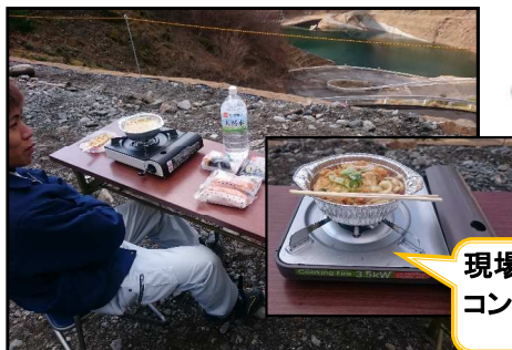
現場が寒くてもコンロで鍋焼きうどん