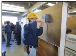
機器取付、電柱や高所作業研修