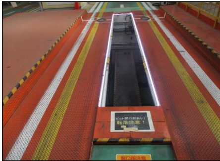
完成ー習志野事務所

創業四十二年信頼と実績 株式会社 新電気 埼玉県三郷市早稲田4-7-9 電話 048-9558-2619 FAX 048-958-3777